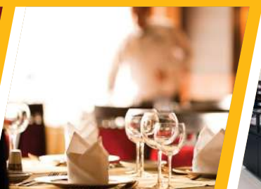
Для сегмента HoReCa