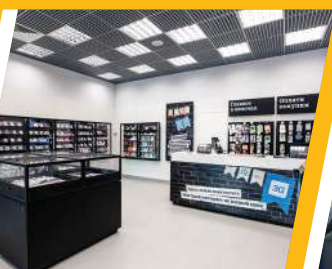
Для сферы услуг