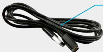
Кабель зарядки и передачи данных