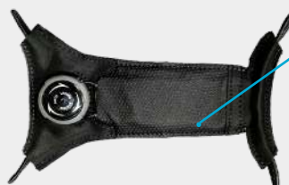
Крепление на руку

имеет на конце прочную резиновую подушечку, для удобного нажатия на экран.