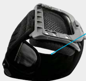
Крепление на руку

обхват руки 215 мм - 350 мм с регулятором размера.